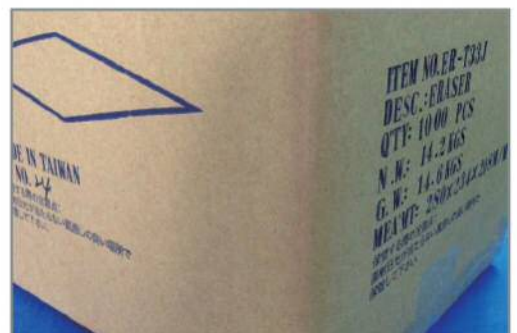
(1000個マスターカートン入り)